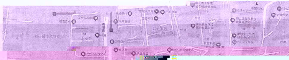
图 1-1 标的所在位置（仅供参考）