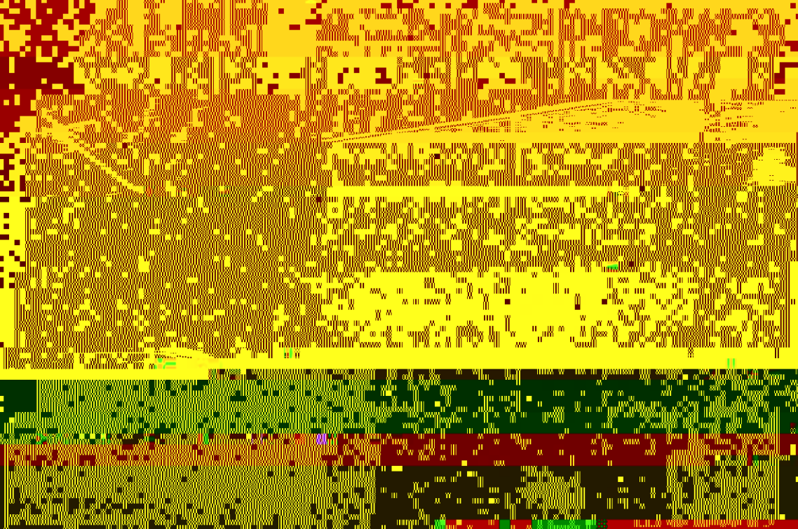
图二 标的实景（仅供参考，以实地勘测为准）